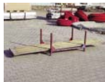
IP4 - деревянная подкладка (+ IP1)

размер: 250 x 67 x 2,6 см EAN: 8595057687707