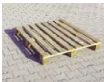
IP3-2 - деревянный поддон