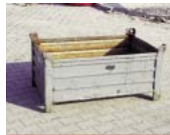
IP2 - ящик железный

размер: 120 x 80 x 60 см EAN: 8595057687653