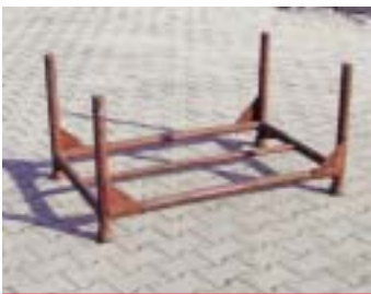
IP1 - трубчатый поддон