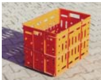
PR - транспортная тара 357-515