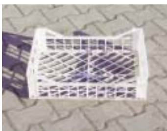
PR PAL - транспортная тара