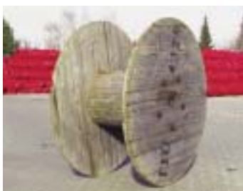
M6500 - барабан M220

размер: 200 x 65 x 2,6 см EAN: 8595057687738