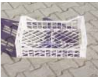
PR PAL - транспортная тара