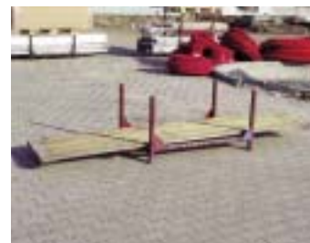
IP4 - деревянная подкладка (+ IP1)

размер: 250 x 67 x 2,6 см EAN: 8595057687707