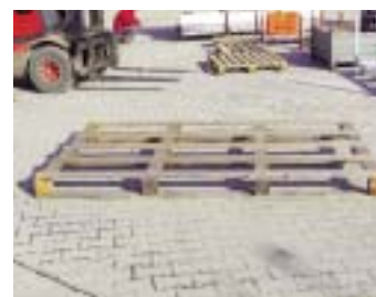
IP3-3 - деревянный поддон