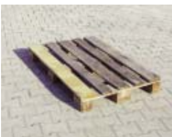
IP3-1 - деревянный поддон

размер: 120 x 80 x 60 см EAN: 8595057687653