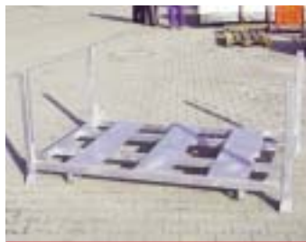
IP10 - железный поддон