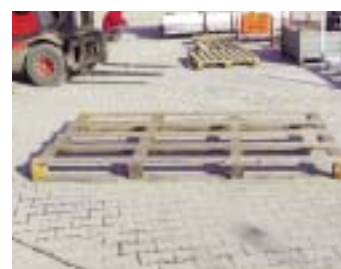
IP3-3 - деревянный поддон